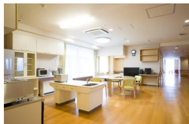
ユニットのリビング